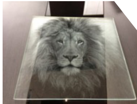
Résultat final en INSCRIPTION-M